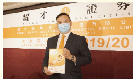
▲ 集團執行董事兼行政總裁許繹彬先生分享後市勝法。

耀才證券於早前召開「2019/20年度股東週年大會」，執行董事兼行政總裁許繹彬表示，去年度逆市純利達4.71億港元，並派發上市十週年特別股息及末期息共港幣1.08元。而本年度首季純利預計約1.53億港元，按年大升53%，更創下同期歷史新高，成績令人鼓舞。同時，客戶人數亦持續錄得顯著增長，截至今年7月31日，集團客戶人數更在四個月內進一步攀升12%至380,000個。逆市中屢創佳績，實有賴客戶一直對集團的支持與信任。