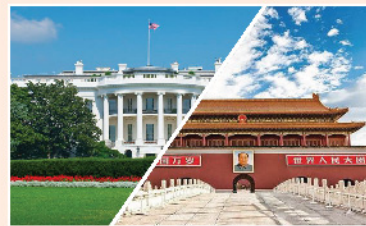
▲ 中美持續角力，為市場帶來不穩定性。

近期，內地市場高位震盪，滬指試圖挑戰7月高點未果，創業板指走勢則轉弱，筆者觀察到，資金逢高兌現，不時試探低位權重，但後者持續性不足，未成氣候，原因為何，下文筆者嘗試進行分析。