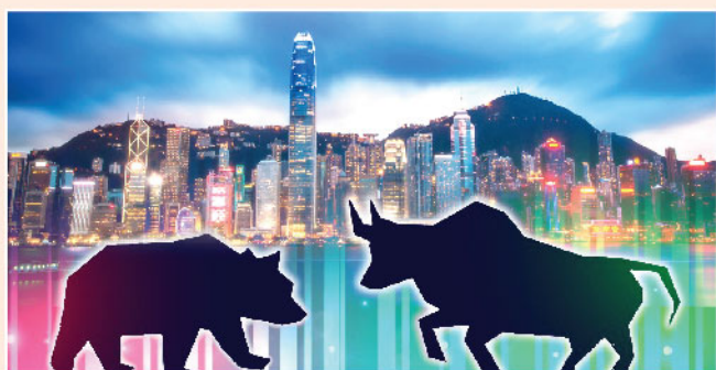
▲ 港股後市缺乏方向，炒股不炒市的格局暫時仍然持續。

此外，於9月份其中一個焦點乃新股熱潮，多隻股份獲過千倍的認購反應，自農夫山泉(9633)首日掛牌後升幅近乎一倍令筆者感到意外，但其後福祿控股(2101)同樣超購過千倍，但升幅表現亦強差人意，料其後的樂享互動(6988)及明源雲(0909)之表現將成關鍵，而新股熱潮會否維持至螞蟻集團上市亦將會是市場焦點。