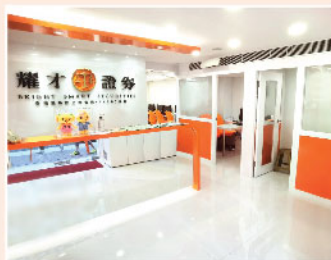
▲ 耀才深水埗分行已換上全新面貌，為客戶提供更優質的服務。