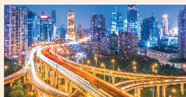
▲ 來年投資，可圍繞「國內大循環」方向部署。

A股9月秋意涼涼，不少投資者持倉遭遇巨大回撤，當下應該如何部署？筆者認為，近期不明朗因素增加，A股集中風險釋放，引發多殺多極端表現，是情緒使然，而非系統性風險出現；展望未來，在內地居民財富轉移、政策紅利和低息環境中，相信A股中期升勢可期，可逢情緒低點積極部署明年投資機會，下文嘗試進行分析。