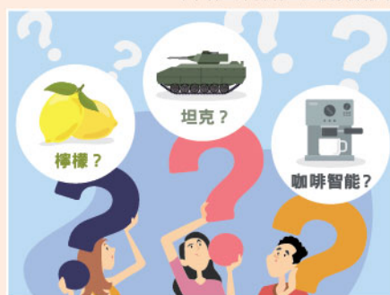
▲「檸檬」、「坦克」及「咖啡智能」其實是長城汽車未來發展大計之名稱。